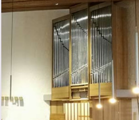
Die neue Trefz-Orgel in Oppenweiler im Entstehen