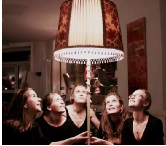
Flauto consort Freiburg

Ich überweise den Beitrag/meine Spende selbst auf das Konto des Fördervereins bei der Kreissparkasse Waiblingen IBAN DE19 6025 0010 0000 8191 74 | Verwendungszweck: Ihr Name + Beitrag/Spende + Jahr