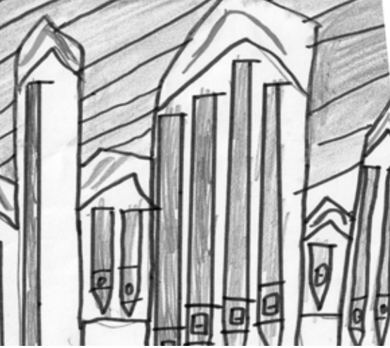
„Orgel“ von Lukas Schulte (2009)