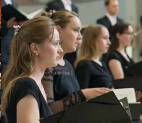
Die Chorgemeinschaft in Aktion