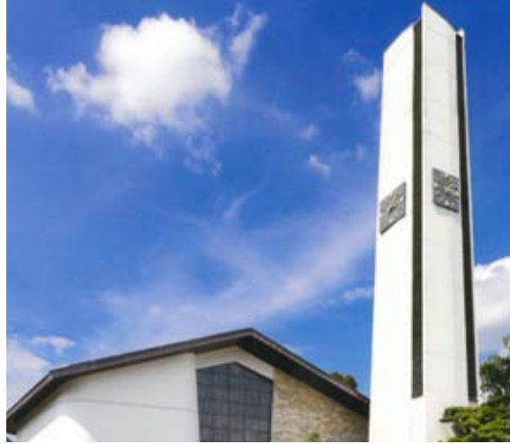
Christkönigskirche im Seelacher Weg